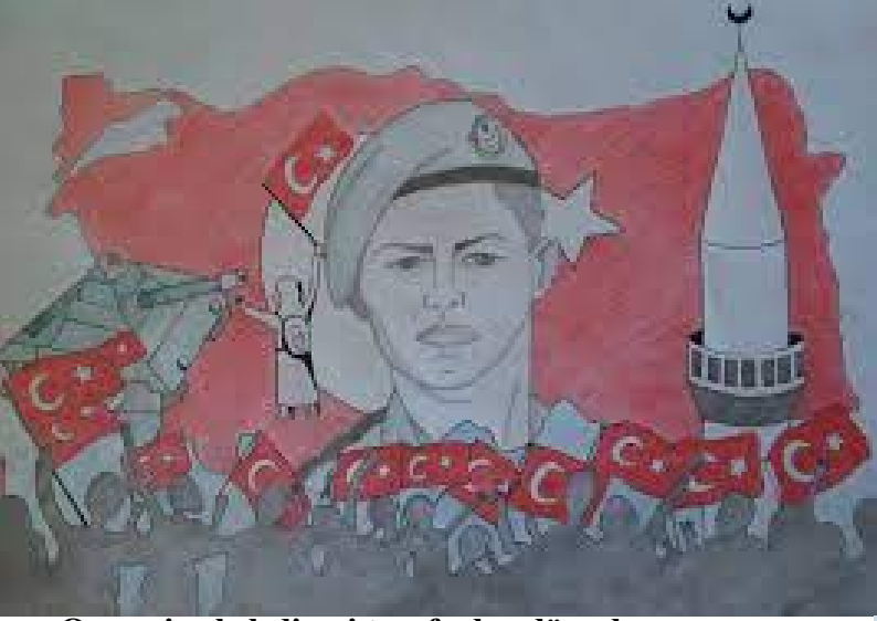
Osmaniye belediyesi tarafından düzenlenen sim yarışmasında dereceye giren ilk üç resimden biri.